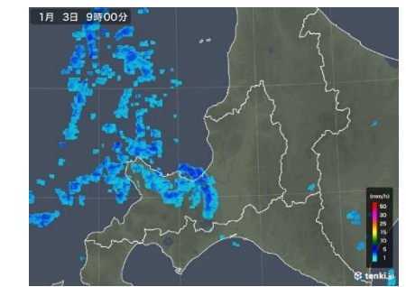
天気図(1/3,6時)と雪雲(1/3,9時) 日本気象協会