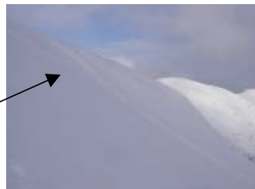
図3 稜線に発達している雪庇の状況