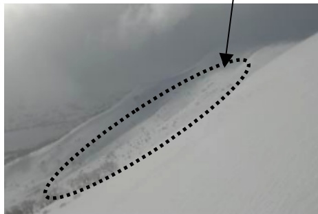
図2 推定雪崩発生斜面の状況