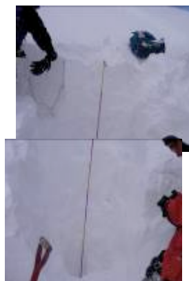
図4 積雪断面観測状況と観測結果