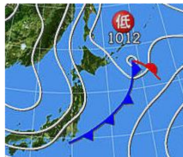
天気図1 2月26日 12時